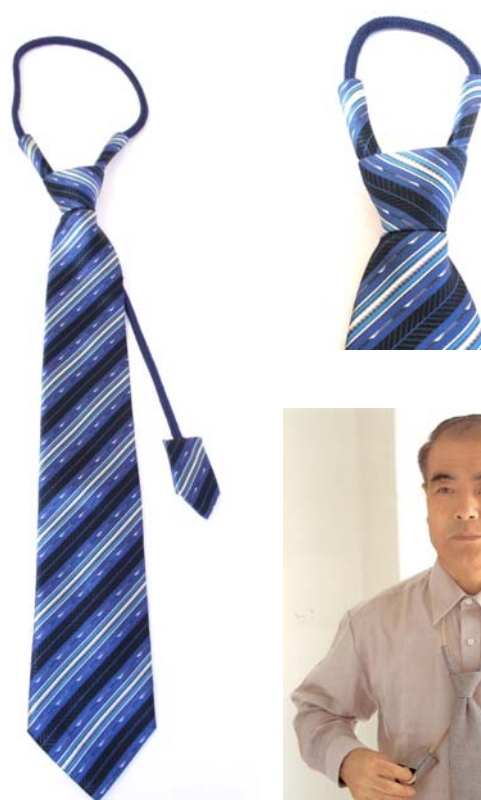
ユニバーサルデザイン ネクタイ ¥8,200