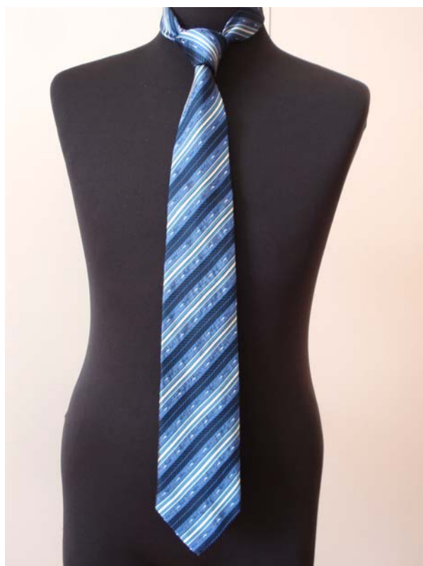
ノーマル ネクタイ ¥5,700

「ノーマルネクタイ」のほか片手で着装できる「ユニバーサルデザインネクタイ」に加工したのも取り揃えています。